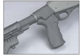
Empuñadura de pistola de la 870.