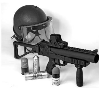
El LL-06 está inspirado en el lanzagranadas del calibre 40mm que aparece en esta fotografía.