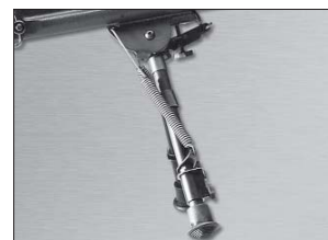
Bípode integrado en la parte delantera.