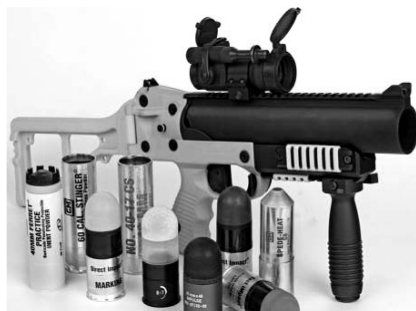
El LL-06 de B&T es la versión menos letal del lanzagranadas GL-06 diseñado por la compañía suiza.