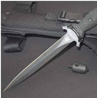
EXTREMA RATIO Suppressor