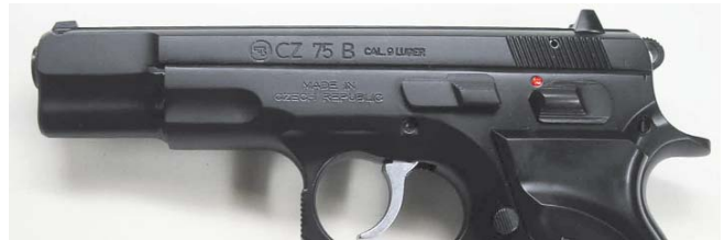
El modelo CZ 75B, equipado con seguro automático en la aguja percutora, fue la primera evolución de esta clásica pistola checoslovaca.