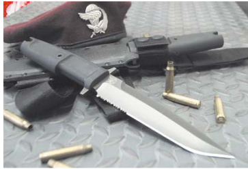
EXTREMA RATIO Col Moschin