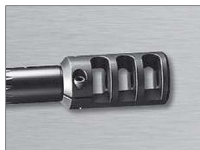
Freno de boca para reducir su retroceso.