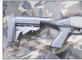
Culata retráctil Knox para la 870.