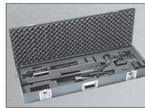
Desmontable para guardarlo en una maleta.