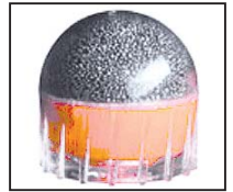
Uno de los proyectiles menos letales que utiliza la carabina FN 303.

La FN 303 es una carabina semiautomática diseñada por la compañía belga FN Herstal que dispara proyectiles de munición menos letal. Uno de los aspectos más identificativos de esta arma es su cargador circular , en el cual caben hasta 15 cartuchos de diversos tipos: pintura, inerte, pimienta, etc. La FN 303 funciona a través de un sistema de aire comprimido (la bombona queda en una posición paralela al cañón) y su diseño es similar al de un fusil de asalto.