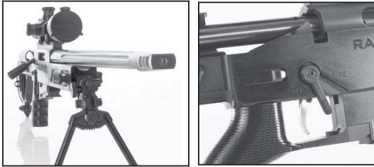
El aspecto del Rangemaster .338LM de RPA es sencillamente imponente.