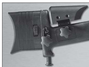
Cantenera y carrillera ajustables.