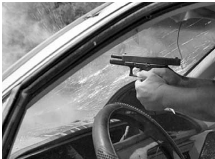
Hay que aprender a responder de forma adecuada ante una situación de peligro.

Al margen de los sucesos acaecidos en los clásicos atracos, no podemos olvidarnos de los acometimientos que sufren los policías durante la identificación de personas (diligencia básica poli-