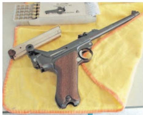
Las Luger P08/14, más conocidas como Luger de Artillería, son de las históricas más buscadas.