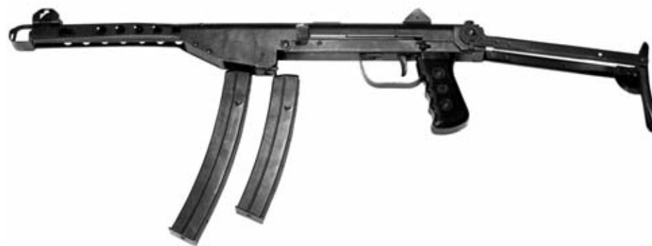
El DUX 53 que aparece en esta imagen fue el primer modelo patentado por Willi Daugs. Al igual que el KP-44 en el que estaba basado, podía alimentarse con cargadores curvos y de tambor.

más tarde compró la casa solariega Vanajanlinna, la cual debería haber sido la residencia de verano del por aquel entonces presidente de Finlandia Risto Heikki Ryti; pero Willi Daugs fue más rápido. En aquel momento, su codicia de dinero y poder parecía no tener límites. Y es que oficialmente, la compañía Tikkakoski Oy sólo fabricaba armas para el ejército finlandés, sin embargo Daugs también suministraba material a otros clientes, entre los que se incluían los movimientos de resistencia daneses y noruegos. Otros suministros fueron a parar a Grecia, Bulgaria y Croacia.