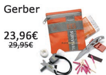
Kit de Supervivencia Basic. Compuesto por 8 piezas.