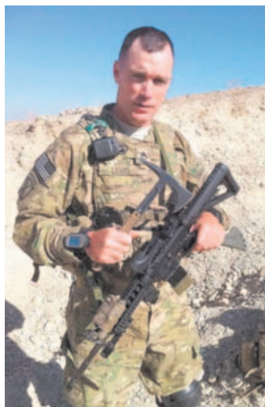
Soldado estadounidense armado con una carabina M4 y un hacha Tomahawk.