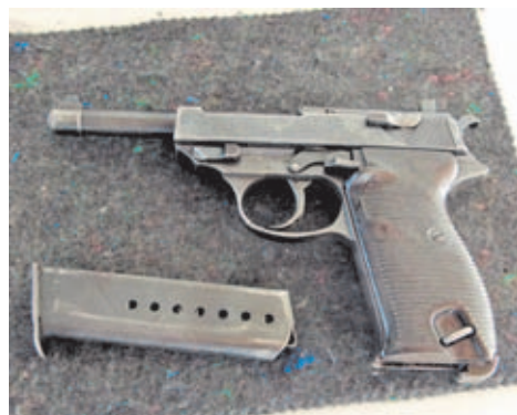
La Walther P38 se convirtió en el arma de dotación oficial del Ejército alemán durante la IIGM.