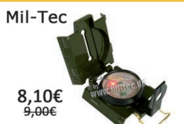
Brújula Ranger Led Compass. Metálica con luz LED incorporada.