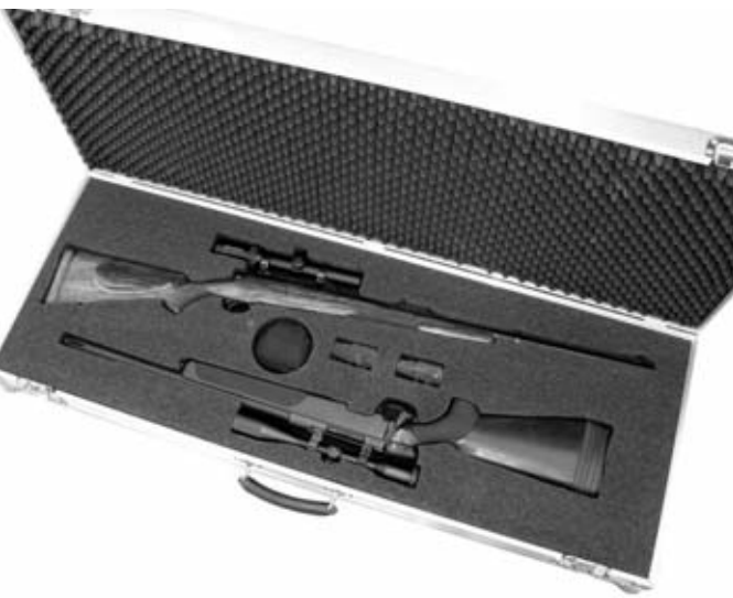
Maletín de transporte con capacidad para dos fusiles, adecuado para viajar en avión.

El paquete ZZ es la denominación que reciben las armas y municiones en un vuelo