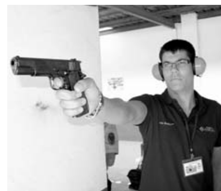
Uno de los participantes más jóvenes empuñando su pistola de combate tipo Colt M1911 A1.