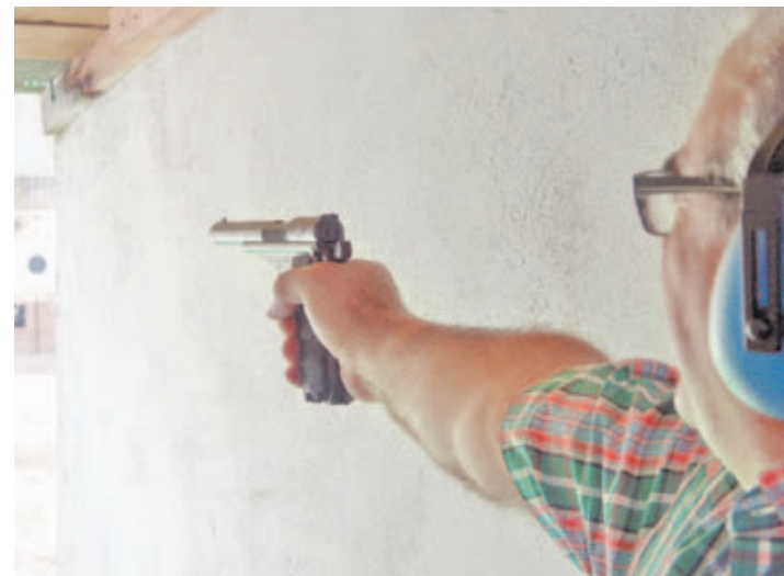
Disparar en precisión con estas pistolas históricas no es una tarea nada fácil, ya que su empuñadura y sus miras no son demasiado cómodas.

Cualquiera de estas pistolas haría las delicias de los miles de aficionados al coleccionismo de armas históricas que habitan en nuestro país; aunque las grandes estrellas de la exposición eran, como es lógico por otra parte, las pistolas "made in Spain". Dentro de este apartado sobresalía la increíble colección de pistolas Astra, con los exóticos modelos Astra 900 en calibre