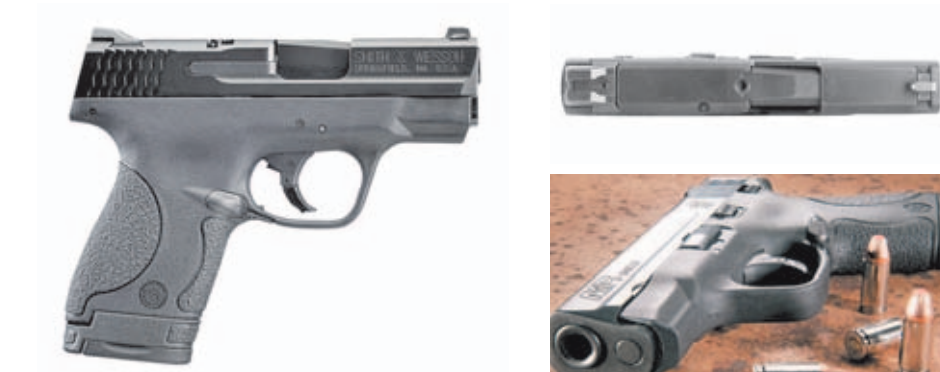
La nueva M&P Shield tiene un grosor inferior a 1" (2,5cm), lo que la convierte en una de las pistolas más finas del mercado. Esta característica favorece enormemente su ocultabilidad.

Esta nueva pistola subcompacta diseñada por Smith & Wesson se caracteriza por su notable delgadez. En este sentido, la M&P Shield sigue la línea trazada por otros modelos como la Walther PPS, la Ruger LC9, o las pistolas ultracompactas de Kahr Arms y Kel-Tec. De hecho, el grosor de la nueva M&P Shield es inferior a 1" (2,5cm), lo que la convierte en una de las armas cortas más finas del mercado. Esta característica incide directamente sobre la facilidad de su porte oculto, sin duda uno de los factores que más se tie-