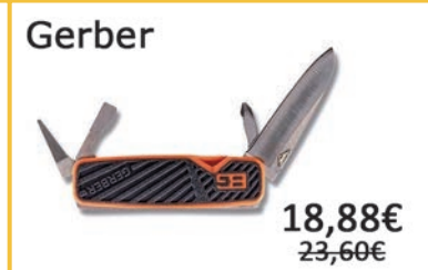
Navaja multiusos. Cachas en material plástico.