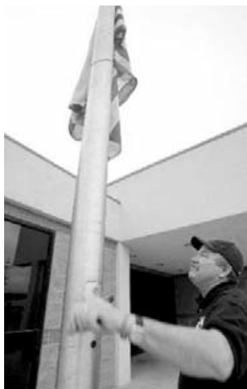
Colocando una bandera a media asta en memoria de un agente caído.

En el caso del municipio sevillano de San Juan se produjo otro rebote, según todos los indicios (el caso está aún sin juzgar). Nuevamente un proyectil dispa-