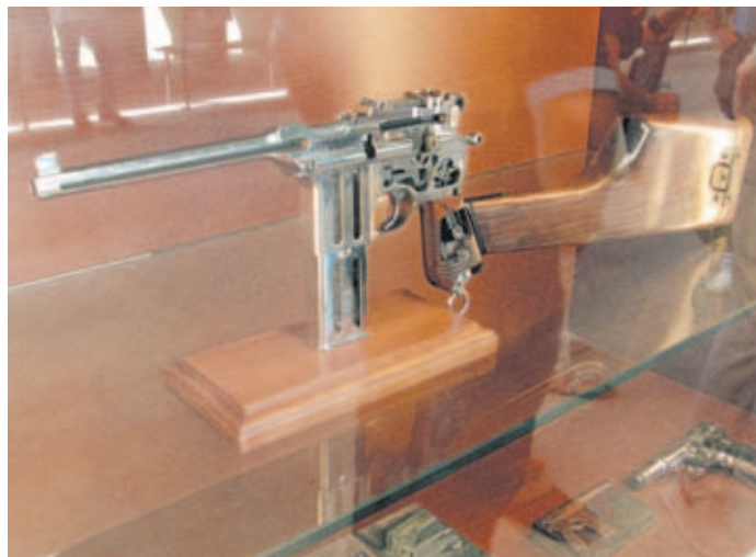
En las vitrinas de la exposición, cedidas por el Museo Histórico-Militar de Valencia, podían apreciarse joyas como ésta, procedentes en su gran mayoría de coleccionistas privados que también participaron en la tirada.

encontraban los miembros de la organización ultimando los detalles de la exposición, convenientemente vigilada en todo momento por varios efectivos de la Guardia Civil y un vigilante de seguridad privada. En esta exposición itinerante, que ya quisieran muchos museos de armas tener en propiedad, se podían contemplar cerca de 60 armas tan emblemáticas como bien conservadas. La mayoría de ellas pertenecían a los propios tiradores, quienes desinteresadamente colaboraron con la organización cediendo sus pistolas para mostrárselas al numeroso público asistente. Decantarse por alguna de ellas era una misión imposible, ya que en sus vitrinas estaban expuestos modelos de auténtica leyenda, como varias unidades de la pistola Mauser C96 acompañados por sus culatines de madera originales; diversos modelos de Luger P-06 y P-08; alguna que otra FN 1910, popularmente conocida como la "Mataducques"; así como varios modelos de pistolas históricas, ligeramente modificadas, para poder ver sus mecanismos de acción internos.