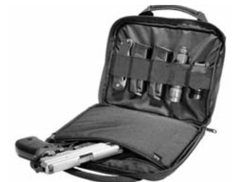
Los miembros de las fuerzas del orden también podrán viajar con armas cuando así lo acrediten.

se notifican al comandante. Una de las recomendaciones (en ningún caso supone una obligación) de la directriz de Seguridad Aérea es que el arma y el cargador vayan por separado. Esta medida viene justificada para evitar que cualquier pasajero pueda arrebatar un arma en un descuido con el cargador. La norma tampoco obliga al agente a entregar el arma al comandante. Si, por cualquier circunstancia, dos efectivos de las Fuerzas de Seguridad del Estado coinciden en el mismo avión portando su arma reglamentaria, el comandante de la aeronave está obligado a presentarlos entre sí. A través de este procedimiento se evitan posibles situaciones de tensión.