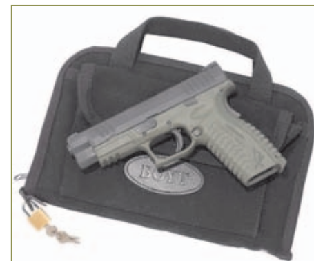
Las armas deben viajar desmontadas y debidamente guardadas en su funda correspondiente.

las armas reglamentadas, cuya adquisición, tenencia y uso están autorizados o permitidos con arreglo a lo dispuesto en la sección 3, artículo 3 del Reglamento de Armas. Las armas deberán ser facturadas y transportadas en la bodega de la aeronave. Le aconsejamos que se presente con suficiente antelación en el aeropuerto para llevar a cabo los trámites que se indican con antelación. Las armas deberán ir descargadas y en su estuche. Las municiones se transportarán en un maletín rígido e independiente del empleado para transpor-