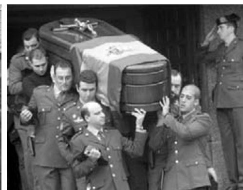
Diversas instantáneas de sucesos con armas de fuego acaecidos en España en los últimos años. A la izquierda, observamos a una persona abatida en el suelo. La misma circunstancia se refleja en la fotografía central (publico.es 27-11-2008). A la derecha, entierro de un agente de la Guardia Civil (elpais.com 18-12-2002).

cial) o en el transcurso de otras acciones policiales cotidianas. La sangre vertida es a veces la de los malvados delincuentes —la buscaron y la encontraron—, otras, la de los siempre mal comprendidos policías; y en ocasiones, la de personas ajenas a cualquiera de las partes. Esto último, si se me permite, es más doloroso aún.