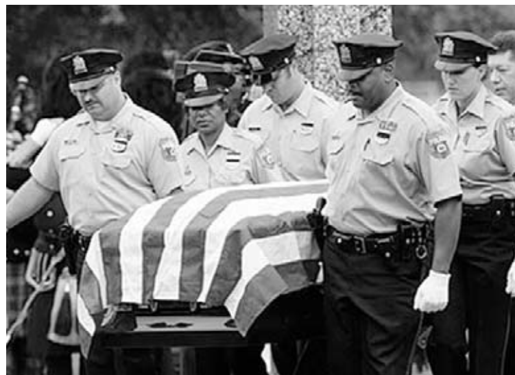
Oficiales de policía estadounidenses portando el féretro de un compañero.