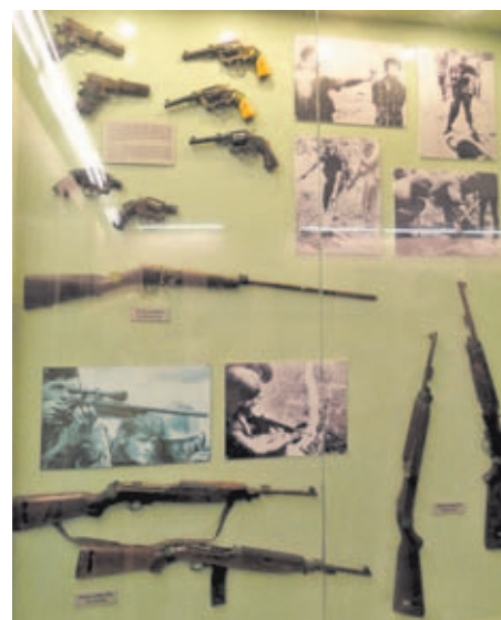
Exposición armamentística en el Museo de la Guerra. A la izquierda, diversas armas cortas y carabinas M1 con imágenes de la época. A la derecha, rifles M14 Garand y fusiles de asalto Colt M16.

En este Museo sólo se exhiben armas y vehículos del Ejército estadounidense