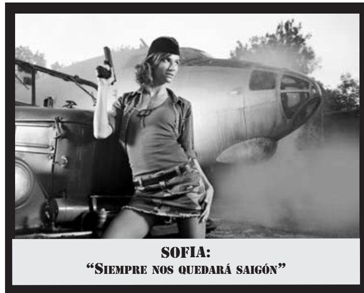
SOFIA: "SIEMPRE NOS QUEDARÁ SAIGÓN"

Durante el pasado mes de julio organizamos un nuevo sorteo para todos los usuarios registrados de www.armas.es . En esta ocasión, los regalos fueron un cuchillo de caza GERBER Freeman Guide 4" y un kit de supervivencia GERBER Bear Grylls. ¡¡No te pierdas el próximo sorteo!!