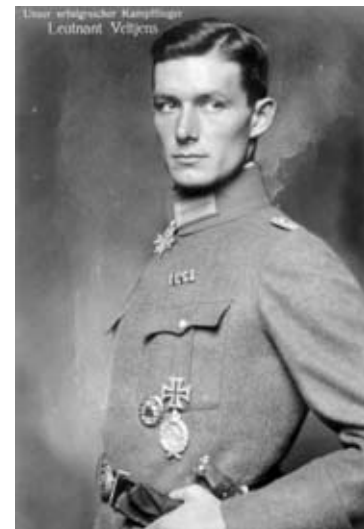
Josef "Seppi" Veltjens en una foto de archivo de la Primera Guerra Mundial.