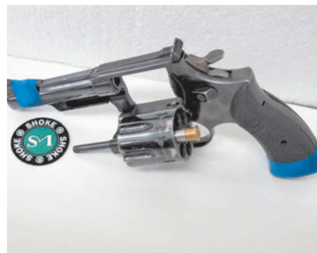
El sistema AirMunition es compatible con diversos tipos de armas, como por ejemplo este revólver del calibre .38 y que en esta imagen aparece "vestido" para disparar cartuchos de AirMunition.

e idéntico funcionamiento. La posibilidad de hacer funcionar las armas de fuego como si se tratase de munición real es la gran novedad y a la vez la mayor ventaja del sistema AirMunition, pues el costo de la recarga de cada cartucho es inestimable prácticamente, una vez se amortiza el equipo de recarga.