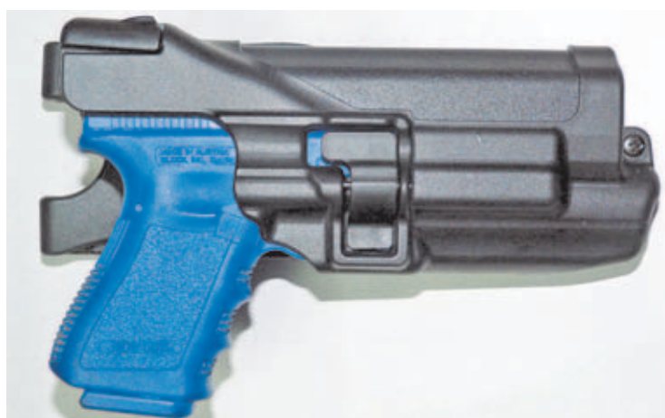
BlueGun Glock 19 con la Xiphos NT montada y encajada en la funda Serpa Nivel 3.

Si bien en el mercado existen gran cantidad de módulos de iluminación simples y otros que incorporan además puntero láser, para mí las opciones eran pocas. Es más, sólo había una: el "Xiphos NT" y explico la razón: Muchos de estos módulos, incluido el "Xiphos NT" se conciben como complementos de quita y pon, de manera que están dotados de sistemas de anclaje al arma rápidos y sin herramientas, por lo que pueden portarse en su funda independiente en el cinturón de trabajo y llegado el momento instalarlo en el arma. Pues bien, personalmente desecho y desaconsejo por completo esta opción, por los motivos que a continuación detallo: