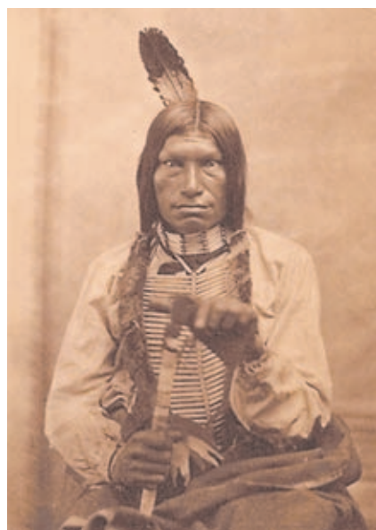
El antiguo jefe de la tribu Sioux, Low-Dog, posa junto a su inseparable Tomahawk.

materiales de superiores características, como el hierro o el bronce. A pesar de esta lógica evolución, también se tiene constancia de diferentes tomahawk más rudimentarios cuya cabeza estaba elaborada con la esquelética quijada de un caballo. La mayoría de estas hachas de guerra contaban con un pequeño mango de madera de unos 50-60 cm de largo, mientras que su cabeza presentaba diferentes diseños. Por una de las caras presentaba el clásico diseño de hacha, con la hoja bastante afilada y cuya función principal era la de cortar casi cualquier superficie que se cruzara en su camino; mientras que en el otro extremo se podía encontrar desde un diseño más puntiagudo, a modo de cuchillo y que se podía clavar fácilmente; hasta uno más redondeado que podía hacer las veces de martillo y cuya función era más bien la de golpear. Como arma de guerra o