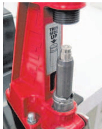
Detalle de un cartucho del calibre 9mm en la unidad de carga.

Este sistema, homologado por la ICAE, es idóneo para la formación en tiro