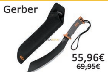
Machete Parang. Longitud total: 51.5cm