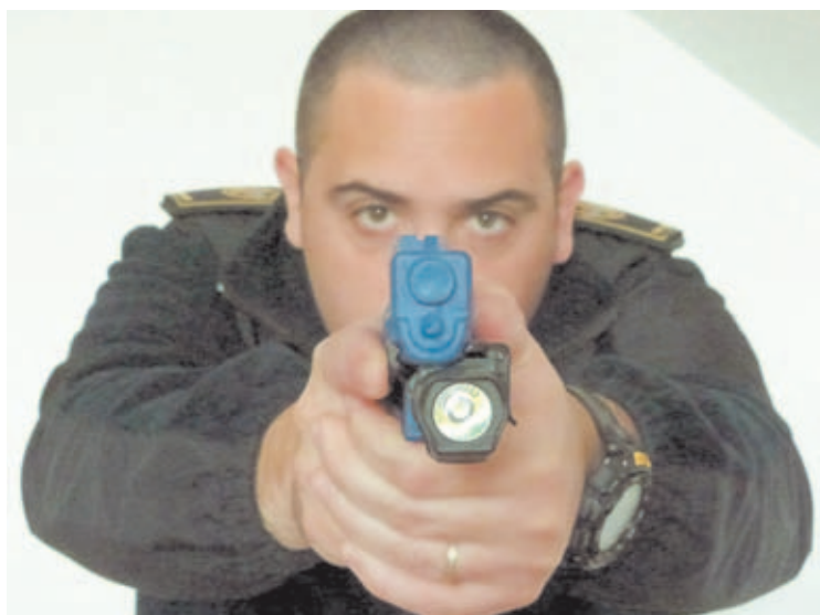
Vista frontal de la lámpara LED del módulo de iluminación Blackhawk Xiphos NT.

Personalmente estoy especialmente sensibilizado con la necesidad de trabajar provisto de una buena linterna, ya que trabajo en un grupo fijo de noches de Policía Local, aunque como suelo recomendar, esta herramienta no debería faltar en el cinturón de ningún policía de calle con independencia del turno en el que trabaje, pues por ejemplo un sótano siempre va a ser oscuro aunque en la calle el sol brille con fuerza, si bien es cierto que en la noche, por razones más que evidentes, la necesidad de una linterna es mayor. Cuando al uso de la linterna debemos añadir el uso simultáneo del arma de fuego, la cosa se complica, y si además hay que abrir una puerta, utilizar las transmisiones, realizar