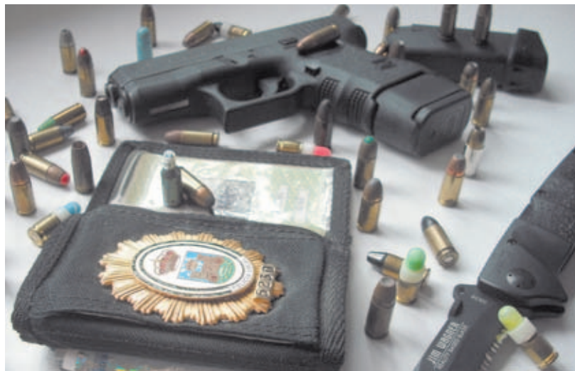
La Autoridad debe perder el miedo a formar a los agentes en materias de armas y tiro.

Otro cuerpo se preocupó por otra cuestión: la pérdida, sustracción o extravío de las armas de sus integrantes. La cosa es que nadie