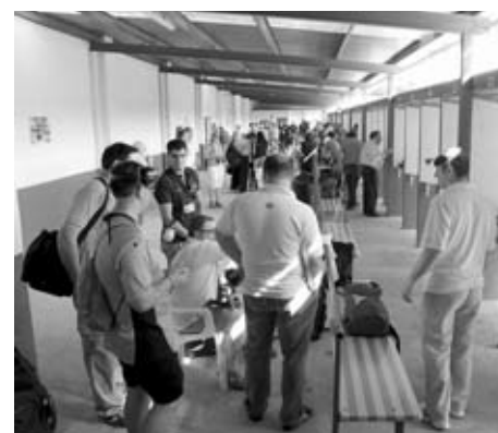
Tiradores de la 2ª tanda acercándose a sus puestos.