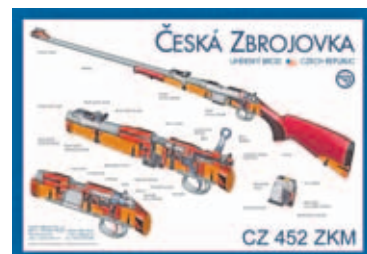
Vista interior de los elementos más importantes de la precisa CZ 452.

binas de la gama CZ 452 pueden conseguirse completamente nuevas entre 500 y 700 euros, en función del modelo elegido y sus características.