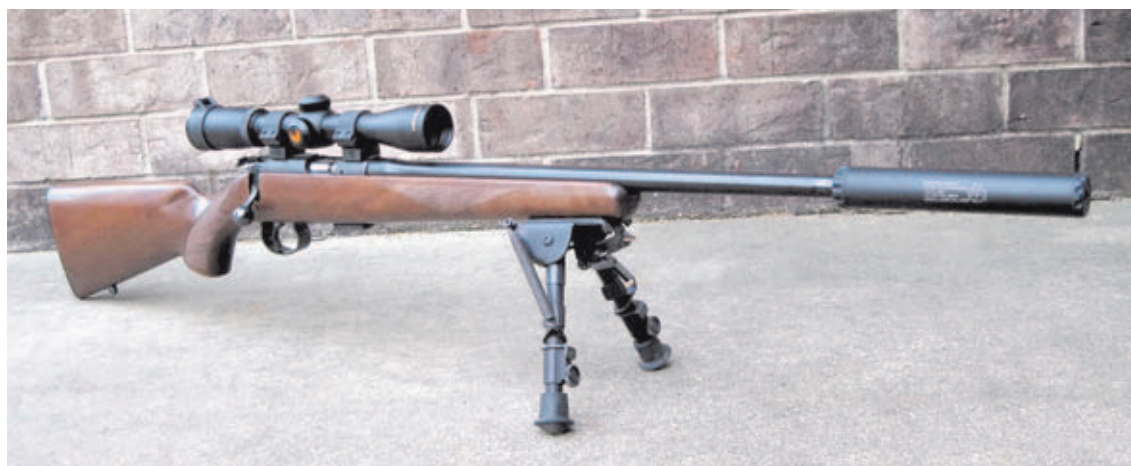
En aquellos países donde está permitida la caza con calibres de fuego anular, como por ejemplo Estados Unidos, la CZ 452 es una de las carabinas más demandadas por su precisión y eficacia. En esta imagen, con un silenciador incorporado.

La CZ 452 nació en la localidad checa de Uhersky Brod, cuna de la mayoría de rifles y pistolas procedentes de la firma Ceska Zbrojovka, más conocida por sus siglas CZ. En esencia, podría decirse que esta carabina es como la versión en miniatura del genial Mauser 98, ya que tanto su sistema de acción de cerrojo manual, como el diseño de su culata y de su siste-