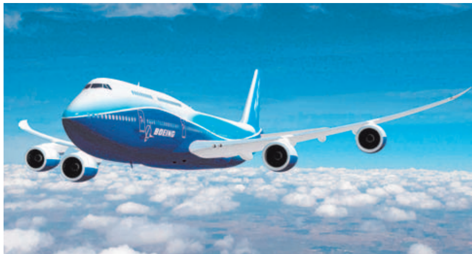
Para un viaje aéreo, las armas deberán ir descargadas y en su estuche de seguridad. Las municiones se transportarán en un maletín rígido e independiente del empleado para transportar el arma.

Cuando se trate de personal de las Fuerzas Armadas, Fuerzas y Cuerpos de Seguridad, del Servicio de Vigilancia Aduanera, o de trabajadores de empresas de seguridad que realicen funciones de