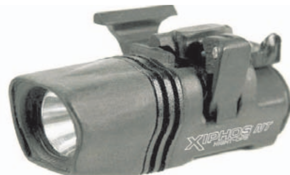
La Xiphos NT ofrece una potencia de 90 lúmenes y 2 modos de iluminación.

3º. La estabilidad del arma que proporciona esta postura es una falsa estabilidad, ya que una vez efectuado un disparo, solo una mano empuña el arma y por lo tanto solo una mano contrarresta