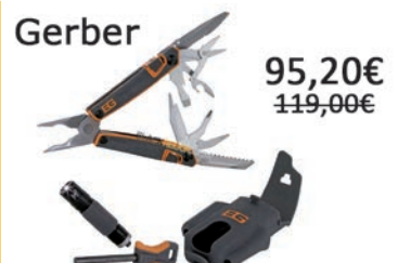
Kit de herramientas para la supervivencia (Survival Tool Pack)