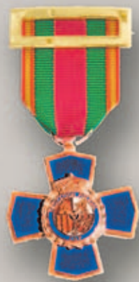
Medalla de Bronce: XX años de Dedicación Policial

Los pasajeros que residen en España y los pertenecientes a la UE que vayan a viajar con un arma, deberán presentar la siguiente documentación en la Intervención de Armas del aeropuerto de partida: DNI o pasaporte, licencia de armas, guía de pertenencia del arma, título de transporte (billete), y Tarjeta Europea de armas (para países de la UE). En caso de que la persona que facture el arma no sea el propietario de la misma, deberá también presentar una autorización del propietario para realizar el trámite de facturación. Por su parte, los pasajeros extranjeros no pertenecientes a la UE que vayan a viajar con un arma,