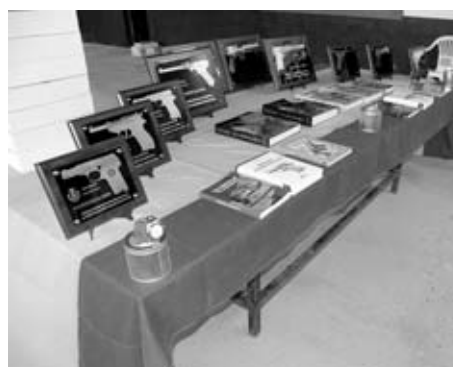
Mesa con todos los regalos, los libros y las placas conmemorativas para los ganadores.