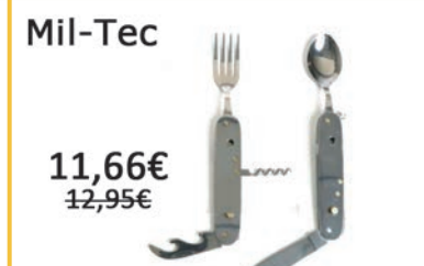
Set Cubiertos en Inox. Tenedor, Navaja, Cuchara, Sacacorchos y Abrelatas.