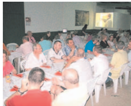
Más de cien comensales disfrutaron de la cena.