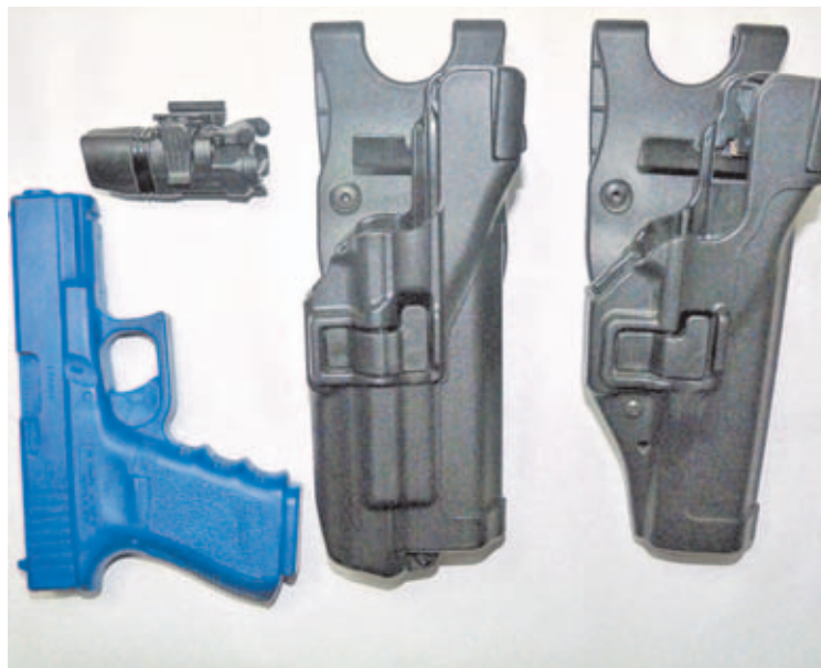
Una de las principales ventajas de este módulo de iluminación es que se adapta perfectamente a la funda de su mismo fabricante, de tal forma que te permite tenerlo siempre instalado en tu arma de servicio.

Por todo ello, no me planteo como opción tener que instalar cada vez que tenga necesidad la linterna en el arma, sino que prefiero adquirir una funda de pistola que me permita llevar ya instalada la linterna en la pistola. Las principales marcas de fundas de pistola del mercado tienen en sus catálogos este tipo de fundas, aunque me resultó extraordinariamente difícil acceder a ellos, y tuve que descartar la opción de verlas y manosearlas en una armería, puesto que en stock no las tiene nadie que yo conozca. Tras informarme a través de Internet traté de pedir mediante un par de distribuidores y por encargo la que era mi elección, lo que finalmente y ante mi sorpresa fue imposible. Parece mentira que sea tan complicado conseguir algo que después de probarlo me parece casi imprescindible