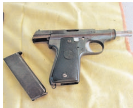
Las pistolas Astra, en sus distintas versiones, siguen gozando del aprecio de los españoles.