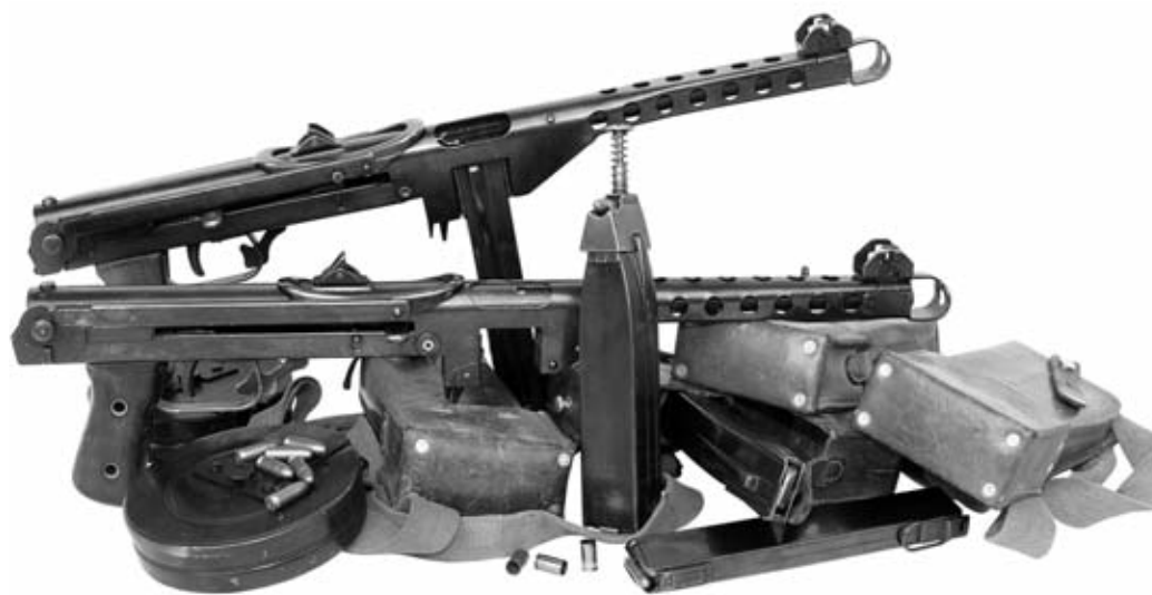
Hoy en día los subfusiles DUX se consideran piezas de colección y son "rara avis" entre los coleccionistas de armas de todo el mundo. Sobre estas líneas, dos modelos con sus cargadores originales.

Durante esta época, Daugs acumuló grandes beneficios económicos. Tanto es así que en 1930, aprovechándose de la gran crisis económica mundial, se convirtió en el accionista mayoritario de la fábrica de armas finlandesa Tikkakoski Oy. Otros accionistas de la compañía fueron los diseñadores de armas finlandeses Aimo Lahti e Yrjö Koskinen, quienes más adelante desarrollaron armas tan famosas como el subfusil Suomi KP-31 (Suomi-konepistooli), el cual arrancó su producción en serie en 1931. Durante ese tiempo, Tikkakoski Oy también fabricó ametralladoras y otros equipos militares para el ejército finlandés. Como consecuencia de todo este proceso, Willi Daugs se hizo rico (en estos tiempos de incertidumbre los libros de pedidos de armamento estaban totalmente llenos) y en 1937 emigró a Finlandia. Y ese mismo año se compró la pequeña isla de Lövö, donde permaneció mucho tiempo. Cuatro años