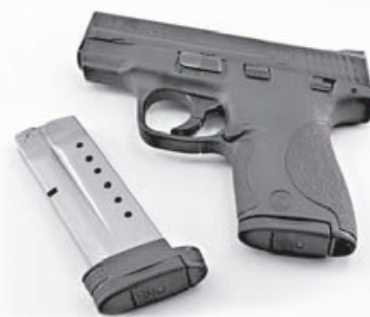
Pistola M&P Shield con doble cargador, uno de ellos con capacidad de carga extra.

ca también por la ergonomía de su empuñadura, la resistencia de los materiales con las que está fabricada (polímero en su armazón y Melonite en su corredera), o lo instintivo de su sistema de miras, entre otras virtudes. Además, como no podía ser de otra manera en un mercado cada día más competitivo, Smith & Wesson ha establecido un precio de venta recomendado para su nuevo modelo Shield de sólo 449 dólares, una cifra que la sitúa en una excelente posición dentro del sector de las pistolas subcompactas para tiro de defensa. En España se espera su llegada para después de verano, aunque todavía se desconoce la fecha exacta en la que estará disponible en las principales armerías de nuestro país.