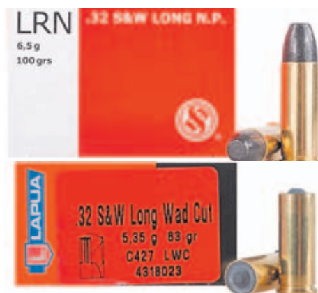
Cartuchos del .32 S&W Long con diferentes puntas.