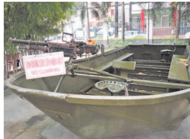
Antiguo bote usado por los Navy SEAL en la zona del delta del Mekong.

El resto de la muestra recoge numerosas e increíbles fotografías de algunos de los reporteros de guerra desplazados a Vietnam, como los japoneses Bunyo Ishikawa y Nakamura Goro, o el británico Larry Burrows, entre muchos otros. Imágenes que expresan sin palabras el horror de una guerra marcada por el uso de bombas químicas como el agente Naranja que asoló grandes extensiones de terreno y