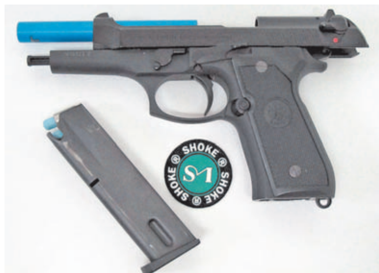
Pistola Beretta 92 con el kit AirMunition y su cargador original con munición.

En el caso del revólver, sea cual sea la marca en calibre .38 Spl, tan solo hay que introducir un "casquillo" en cada recámara del cilindro, para que ésta se ajuste al cartucho recargable de 7,8 mm. De esta forma, además se evita que el revólver se cargue accidentalmente con un cartucho de fuego real, pues éste no cabría en las recámaras. Para las pistolas, es necesario cambiar el cañón y el muelle recuperador, para que las armas automaticen y cambien el calibre. Mismo armazón, mismo cargador