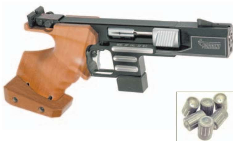
Pistola de tiro deportivo Pardini HP del .32 WadCutter. Este tipo de puntas, muy habituales en los cartuchos del calibre .32 S&W Long, son de las más extendidas.

Con el paso de los años, y una vez que sus propiedades para el sector de la defensa se vieron claramente superadas, el .32 S&W Long comenzó a hacerse con un hueco cada vez más importante entre los tiradores deportivos, quienes vieron en el 32 Largo un calibre preciso, con poco retroceso, y capaz de ofrecer grandes resultados en unas manos bien entrenadas. Ante la creciente demanda de este tipo de munición por parte de los tiradores olímpicos, especialmente de los cartuchos con proyectiles Wadcutter