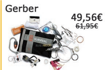
Kit de Supervivencia Ultimate. Compuesto por 16 piezas.