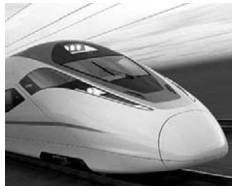
Los viajeros que se desplacen en tren con armas deberán portarlas descargadas y en lugar seguro.

arma y el cargador vayan por separado. Sin embargo, la norma española de seguridad aérea se ha convertido en una auténtica incógnita para muchos comandantes de aviones comerciales. El desconocimiento más absoluto les ha llevado a contravenir lo estipulado y despojar a policías y guardias civiles de su arma en acto de servicio. La normativa española es bien clara. Todo miembro de las Fuerzas de Seguridad del Estado, ha de portar consigo su arma al subir a un avión. Eso sí, ha de cumplir un exhaustivo protocolo desde instantes antes de subir a la aeronave.