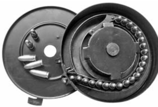
A la izquierda, detalle de la recámara y la ventana de expulsión de un subfusil DUX. A la derecha, una imagen del clásico cargador de tambor con varios cartuchos del calibre 9mm Parabellum.