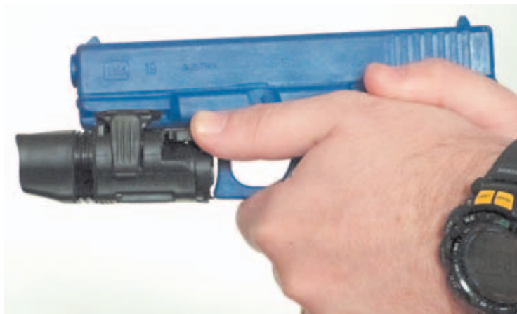
Posición de activado. La linterna tiene una operatividad rápida y sencilla.

El módulo de iluminación es compacto y muy ligero. Está fabricado en polímero, posee un LED que arroja unos eficientes 90 lúmenes, la alimentación