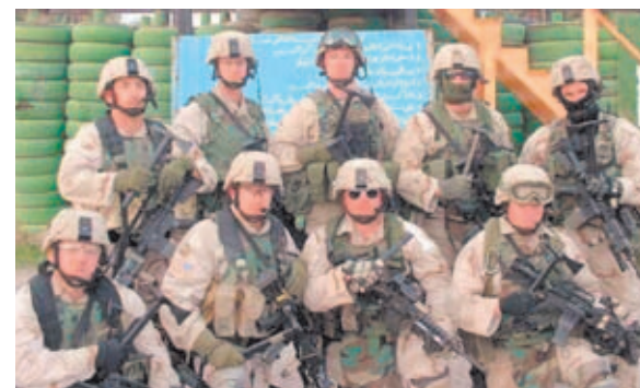
Algunas unidades especiales del Ejército estadounidense se han equipado con Tomahawks de dotación oficial.