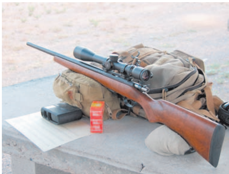
A simple vista, esta carabina parece el hermano pequeño de un rifle Mauser. Con él comparte su legendario sistema de acción de cerrojo manual.

Por lo que respecta a su alimentación, la mayoría de versiones de la 452 suelen emplear un cargador extraíble con capacidad para 5 o 10 cartuchos del calibre .22LR, sin duda el tipo de munición más extendido entre los propietarios de esta carabina en nuestro país. Con esta combinación de carabina y cartucho se han conseguido excelentes agrupaciones desde hace muchos años, e incluso se han ganado diversos Campeonatos de Bench Rest (alta precisión) tanto autonómicos como nacionales. De ahí que todavía hoy en día la CZ 452 siga siendo una de las carabinas con más seguidores entre los tiradores españoles. Una "vieja roquera" que resiste a morir.