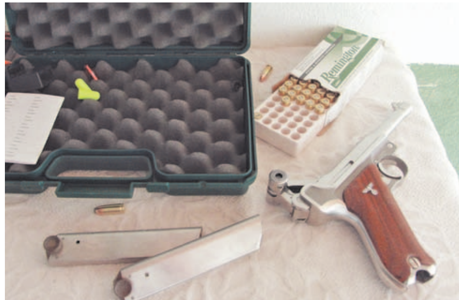
Las pistolas Luger fueron las "reinas" del campeonato. Los participantes demostraron que, además de conservarlas en perfecto estado, son armas muy fiables y precisas.