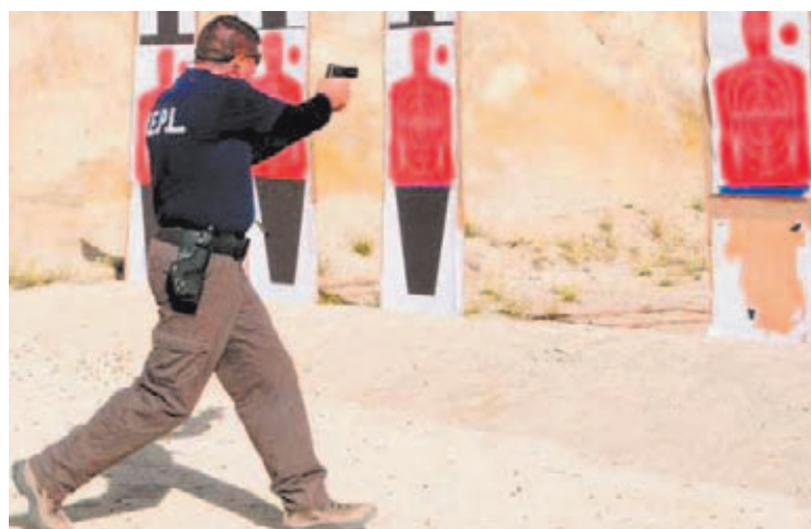
Sólo con un entrenamiento adecuado, eficaz, y adaptado a la realidad podremos hacer frente a las posibles agresiones que nos encontremos en nuestro trabajo.

dependencia del Departamento de Justicia norteamericano, el Federal Bureau Investigation (F.B.I.) es la agencia federal encargada de recopilar múltiples datos sobre delitos en general. Esa información, una vez es tratada y analizada, se “vuelca” en un complejo programa informático de estadísticas. El programa Law Enforcement Officers Killed and Assaulted (LEOKA) , u Oficiales de Policía Asaltados y Asesinados, es el que emplea el F.B.I. para estudiar todo lo con-