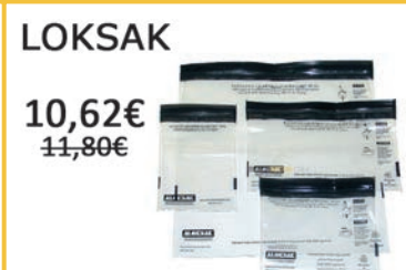
Pack de bolsas herméticas. 4 bolsas de diferente tamaño.