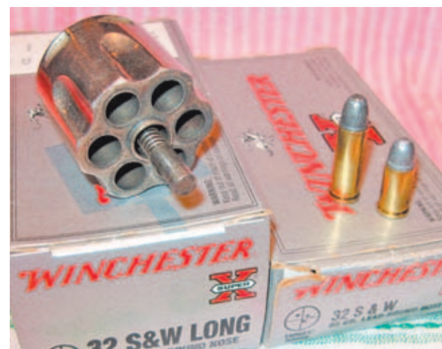
Tambor de un revólver del .32 S&W Long junto a dos cartuchos de arma corta: el más alto del .32 S&W Long, y el otro del .32 S&W.