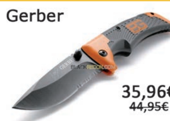
Navaja Scout. Hoja: 8,4cm Largo total: 18,5cm