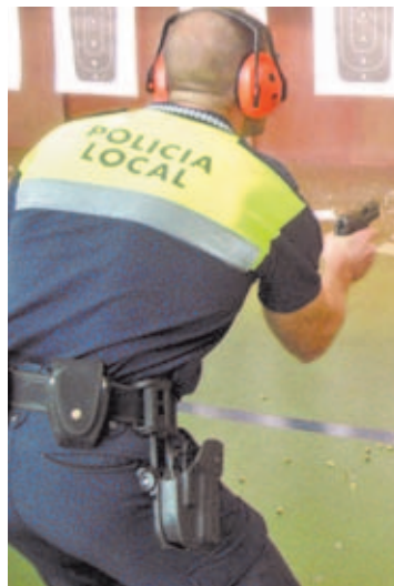
Los agentes deben aprender a manejar con soltura su arma de dotación.