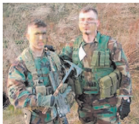
Los nuevos Tomahawk del siglo XXI están fabricados con materiales más ligeros y resistentes.

Los nuevos tomahawk emplean materiales mucho más sofisticados que los primeros modelos de piedra o de esqueleto de caballo. Estos cambios se plasman tanto en el material con el que están fabricadas sus hojas (acero forjado y mecanizado de gran dureza), como en el que presentan sus mangos (polímeros y nylon de gran resistencia). Aunque hay un elemento que se mantiene intacto respecto a los primitivos tomahawk usados por los nativos americanos: su incuestionable efecto intimidador.