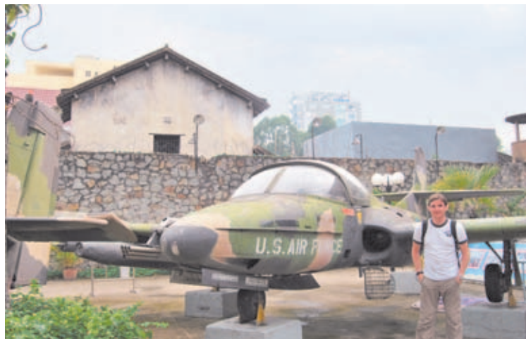
Avión de combate del US Air Force pintado en tonos camuflaje Woodland.

En esta exposición armamentística también se exhiben algunas armas cortas de la época en bastante buen estado de conservación. Como es lógico, dentro de este apartado no faltan las pistolas Colt M1911 del calibre .45 ACP, de dotación entre los oficiales del US Army; así como algunos revólveres con cañones de diferentes tamaños, ampliamente utilizados por los miembros del antiguo Ejército de Saigón (una especie de policía pro estadounidense). En las vitrinas de este Museo también podemos encontrar varias unidades del subfusil Thompson, del clásico rifle semiautomático M1 Garand, así como de diversos mode-