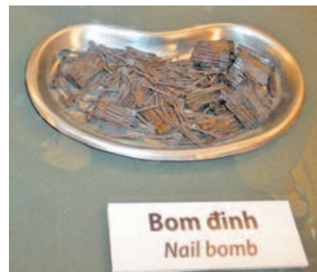
Las bombas de clavos se convirtieron en una terrible metralla durante esta sangrienta guerra.

causó terribles malformaciones entre la población expuesta a estas armas químicas. Por último, a la salida del Museo, una placa nos recuerda que casi 60.000 estadounidenses perdieron la vida en Vietnam, mientras que fueron más de 3 millones los vietnamitas que murieron durante la guerra (2 millones de ellos pertenecientes a la población civil). Cifras que nunca se deben olvidar.