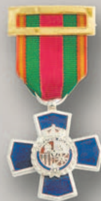
Cruz de Plata: XXV años de Dedicación Policial