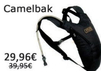
Mochila de hidratación Tactical Hydrobak. Capacidad 1.5 L.