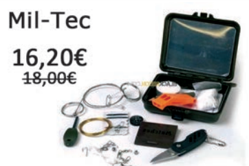
Kit de supervivencia. Compuesto por 13 piezas.