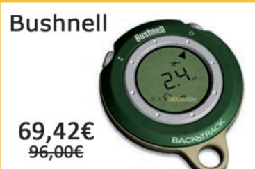
Localizador BACKTRACK. Verde. Brújula gps digital automática.