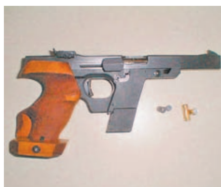
Walther GSP del calibre .32 S&W Long, una de las preferidas entre los tiradores de precisión.