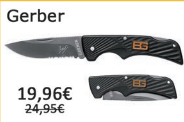
Navaja Compact Scout. Ligera y de tamaño compacto.