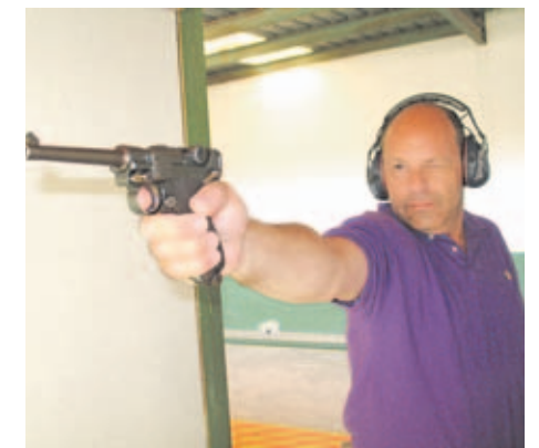
Las pruebas de tiro se realizaron a 25 metros.

te" del fin de semana: la tirada de precisión con estas joyas de la historia armamentística.