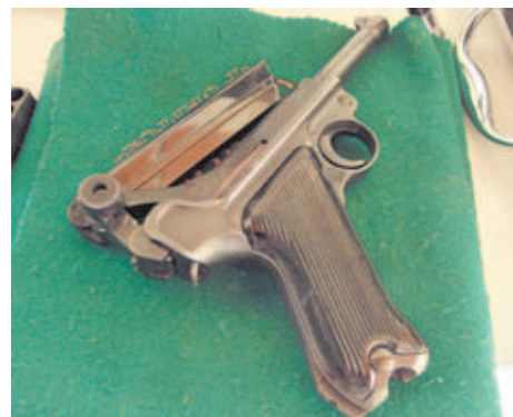
La oferta actual de pistolas Luger es muy amplia, y existen multitud de configuraciones y acabados.