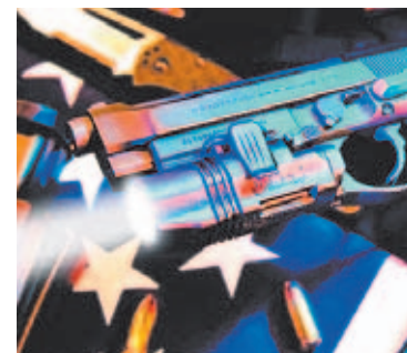
Blackhawk Xiphos NT instalada y activada sobre una Beretta 92.

la reelevación del arma, por lo que esta reelevación es bastante grande, encontrando el arma tan solo estable durante el primer disparo y no en cambio en una secuencia rápida de disparos, como es muy probable que se produzca en una situación de enfrentamiento armado.