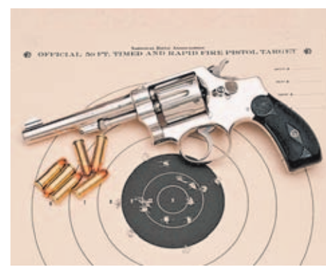
La combinación entre un buen revólver y unos cartuchos del calibre .32 S&W Long garantizan, en manos expertas, unos buenos resultados.

(achatados), los grandes fabricantes de munición no dejaron pasar la oportunidad y se lanzaron a la comercialización de diversas series de cartuchos de este calibre, con diferentes cargas. Las más comunes oscilaban entre los 85, 90, 95 y 98 grains, mientras que las velocidades ofrecidas oscilaban entre los 220 y los 235 m/s. Remington, Fiocchi, Magtech, Federal o Winchester son sólo algunas de las marcas que desde hace varios años fabrican grandes y variados lotes de esta munición, hoy más deportiva que nunca.