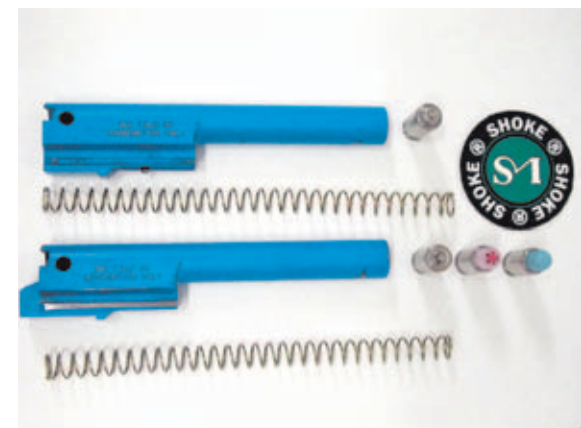
Kits de conversión AirMunition para pistolas del calibre 9mm Pb formado por el cañón y el muelle recuperador.