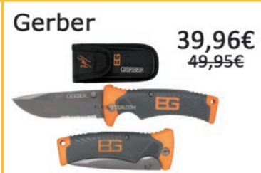
Navaja Survival Series. Largo total: 21,5cm