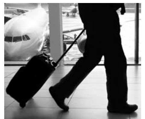
Viajar con armas es muy habitual entre cazadores.

El primer paso es documentar las armas en la Guardia Civil del aeropuerto