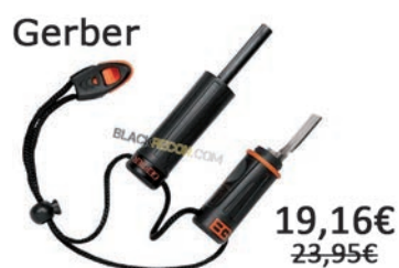
Encendedor Fire Starter. Incluye silbato de emergencia.