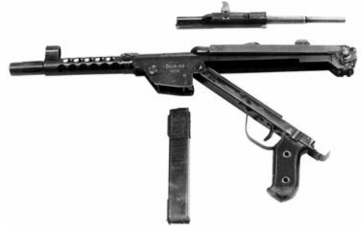
Despiece básico del modelo DUX 59. 25 unidades como estas se entregaron al nuevo Ejército alemán posterior a la IIGM para los tests de selección.

armas a su auténtica nación: Alemania. Dougs fue enjuiciado por el Tribunal de la Ciudad de Estocolmo, pero a pesar de las numerosas denuncias que cayeron sobre él, nunca fue condenado.