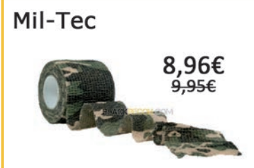
Cinta adhesiva Camo Woodland. Tamaño 4,5 metros.