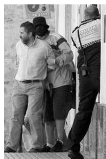
Imagen de un atraco con rehenes a una sucursal bancaria en la localidad de Tarifa (Cádiz). Año 2007.