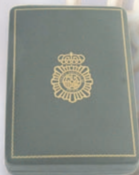
Encomienda de Oro: XXX años de Dedicación Policial