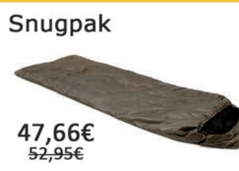
Saco de dormir Jungle Bag. Con aislante "Travelsoft".