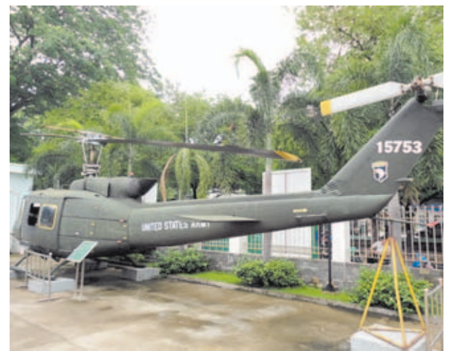
El helicóptero fue uno de los vehículos más usados durante la guerra de Vietnam. Sobre estas líneas se muestra un modelo en muy buen estado de conservación con el escudo de la 101st Airborne.

de una época muy dolorosa para todos. A día de hoy, esta exposición recibe más de 500.000 visitantes cada año, lo que le convierte en uno de los principales atractivos de la zona sur de Vietnam.