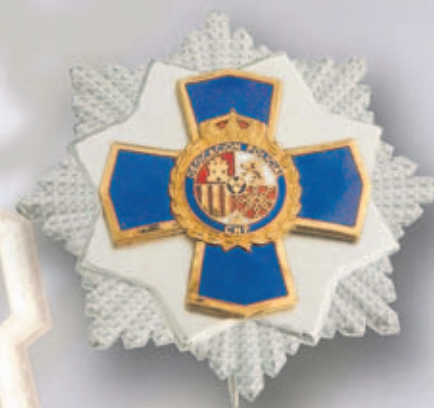
Placa de Oro y Plata: XXXV años de Dedicación Policial

Consigue la nueva Condecoración a la Dedicación Policial