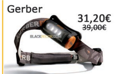
Linterna frontal. Lumens: 25 Autonomía: 5 horas.