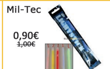
Luz química 1x15cm - Verde. Duración entre 8-12 horas.