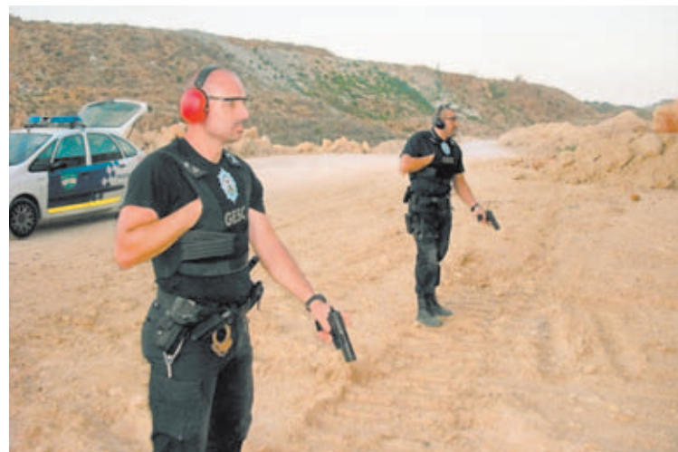
La Administración jamás ha querido admitir que la formación en materia de tiro policial o tiro defensivo es casi siempre nimia. Esto obliga a los agentes que lo desean a formarse por su cuenta, acudiendo a la formación privada.

Pese a que el F.B.I. es quien más pábulo otorga a sus informes, siendo éstos además los más respetados, pueden que existan datos o estudios obtenidos por otras agencias o cuerpos policiales del país estadounidense. Por ello, debemos ser cautelosos a la hora de comparar estadísticas. En cualquier caso, si atendemos a los datos reflejados en estos informes, seguro que podremos obtener reveladores indicios de qué es lo que ocurre “ahí fuera”, y sobre todo, cómo ocurre y cómo responden los agentes. Impulsemos por tanto un LEOKA made in Spain .