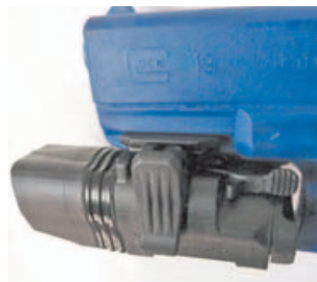
Linterna colocado sobre el rail Weaver/Picatinny de una BlueGun.