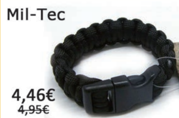
Pulsera Paracord de 15mm. Varios tamaños y colores.