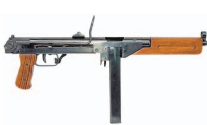
Una versión más moderna y mejorada del subfusil DUX. Desde esta perspectiva se observa su culata metálica plegable y su espartano diseño.

Willi Daus logró escapar a la neutral Suecia en 1944. Allí vivió como un apátrida hasta el final de la guerra y los años inmediatamente posteriores. Pero Daus no pudo escapar por completo de su pasado y en 1948 se enfrentó a un juicio por los envíos ilegales de