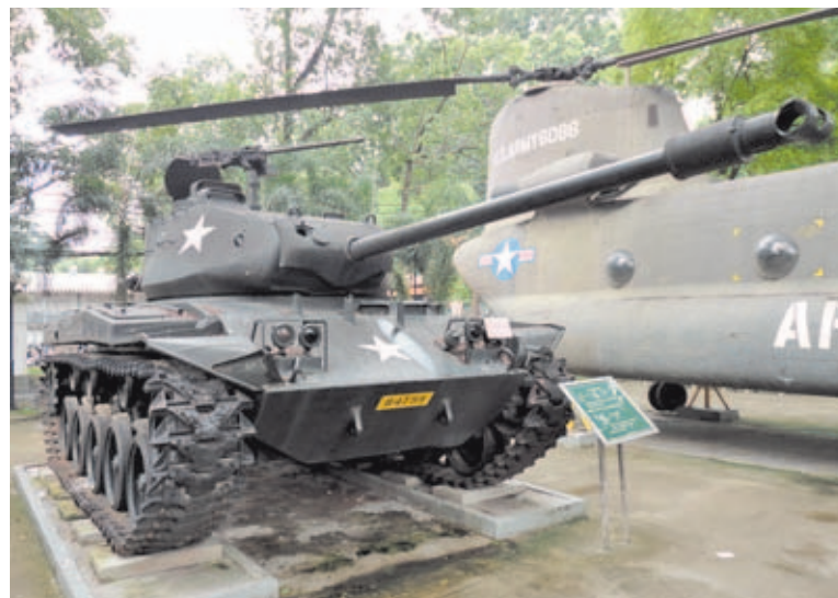
Carro de combate M48 A3 expuesto junto a un Boeing CH-47 Chinook.

Actualmente, el Museo está dividido en 7 salas o zonas en las que, de forma temática, se muestran los acontecimientos más importantes vinculados a la guerra entre Vietnam y Estados Unidos. Desde su apertura, hace ya casi 37 años, el Museo ha recibido innumerables visitas de jefes de Estado y delegaciones de paz internacionales, así como numerosos turistas y ciudadanos del propio país vietnamita que encuentran en este Museo un recuerdo imborrable