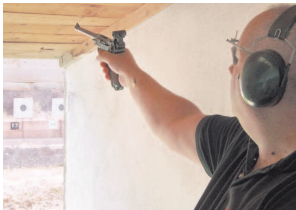
Controlar la reelevación con este tipo de armas es otro de los aspectos más difíciles de dominar. En esta imagen se aprecia perfectamente lo alto que se eleva una Luger P-08 tras cada disparo.